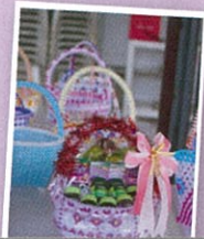
ตระกร้าทรงโบราณที่ปัจจุบันหาได้ยาก สามารถทำหรือใส่ของหรือมอบเป็นของขวัญก็ได้