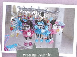
พวกคุณแจกลูกปัด