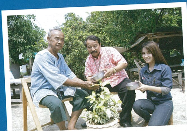
งานโอกาสกัลวันสงกรานต์ พัดสี-ไฟโรจน์ สุพรรณวิรัตน์" แห่งชุมชนหนองไผ่เย็น จังหวัดน่านองรังคนสวยจาก SCG Chemicals

"ถ้าเราไม่มีโรงงาน ระยองก็คงจะไม่รุ่งโรจน์เหมือนเดี๋ยวนี้นี้ แต่ก็อยากจะฝากโรงงานอย่าได้ทิ้งชุมชนและอย่าลืมดูแลเรื่องสุขภาพของคนในชุมชนด้วยนะ" กำนันถัด กล่าวทิ้งท้าย