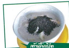
เต้าหู้โยเกิร์ต

อ้อ..ลืมบอกไปใช่ไหมว่า ที่นี่เขาเน้นให้บริการผักสดสำหรับซื้อหาไปทำสลัดหรือจะปรุงเป็นเมนูเด็ดทานกันเองที่บ้าน ทว่าบริเวณด้านหน้าได้จัดเป็นคอฟฟี่ช็อปให้นั่งจิบกาแฟรสชาติดีและมีน้ำผลไม้สดชื่นไว้ให้บริการ