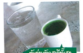
ต้นอ่อนหัวผักกาดคั้นสด

พระเอกของร้านต้องยกให้ "ต้นอ่อนข้าวสาลีคั้นสด" ขอบอกว่า..ดื่มแล้วคุณจจะเข้าใจคำว่า "คุณภาพคับแก้ว" เป็นอย่างไรได้ทันที อธิบายความให้อีกนิดว่าแก้วนี้อุดมไปด้วยโคโรฟิล ช่วยฟอกเลือด ฟอกตับ และขจัดพิษ ส่วนนางเอกของร้าน ก็คือ "เต้าหู้โยเกิร์ต" ซึ่งประกอบด้วยผลไม้สดอย่างแคนตาลูป ถั่วแดงกล้วยหอมแอปเปิ้ลราดด้วยโยเกิร์ตซึ่งทำจากนมถั่วเหลืองและโรยหน้าด้วยงาดำ เพื่อนข้างรับประกัน ความอร่อย..คร้าบ